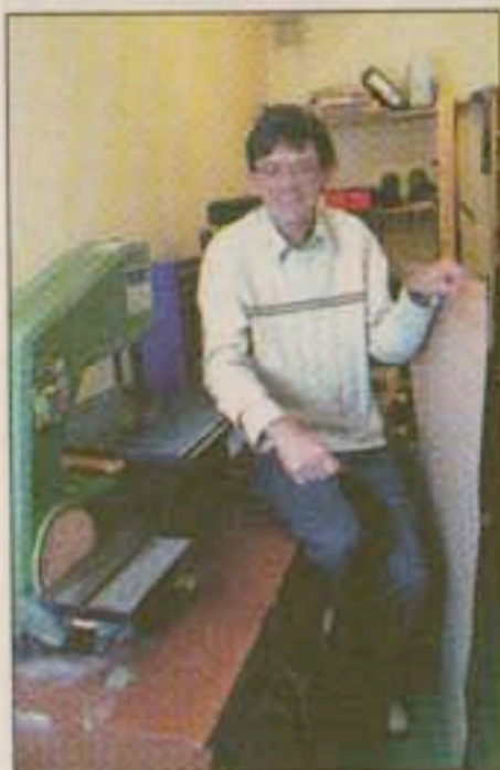
Egna spel. I källaren hemma i Bengtsforsvillan pågår tillverkning av spel som är roliga och bra för mattekänslan. Plywoodskivan ska bli spelplaner för Hex.

ning av spel som är användbara i mattesammanhang. Det finns massor. Paret Rydhs produktion, där hustrun står för det praktiska arbetet hemma i källaren, är än så länge inriktad på Hex, ett populärt enkelt strategispel, och Pentomino, ett matematiskt byggspel, spansk domino och Xiang Qi, kinesisk variant på det västerländska schackspelet.